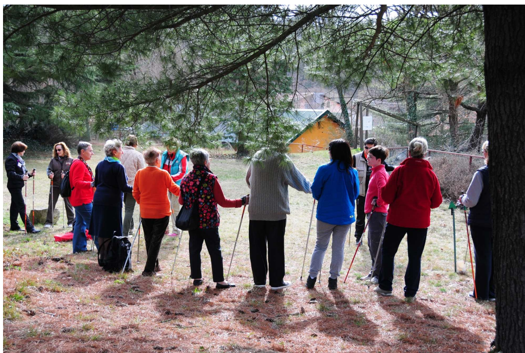
2. Lezione dimostrativa nella giornata: Nordic Walking di primavera