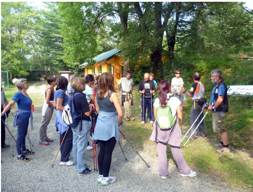
1. Lezione di nordic walking al Parco della Polveriera