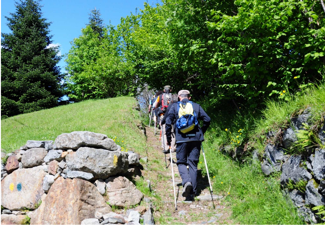
3. Escursione guidata al Nordic Walking Park di Andrate