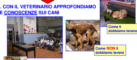
Come li dobbiamo tenere

1. CON IL VETERINARIO APPROFONDIAMO LE CONOSCENZE SUI CANI