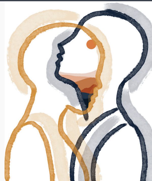
Illustrazione di Daria Patrascu (Liceo Gallizio, Alba)