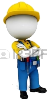
Sig. RAPPRESENTO RLS Operaio impresa serramenti THE DOORS