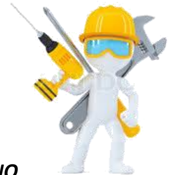
Sig. PALLINO Operaio impresa serramenti THE DOORS