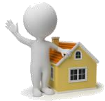
sig. ROSSI committente