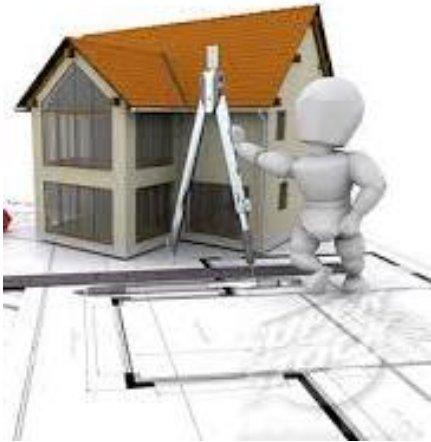
geom. BIANCHI responsabile dei lavori e della redazione del POS del cantiere