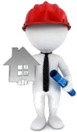
arch. BIANCHI C.S.E.