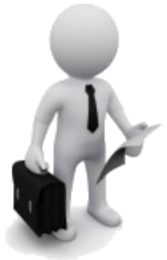
sig. VERDI DL Impresa affidataria EDILGAMMA