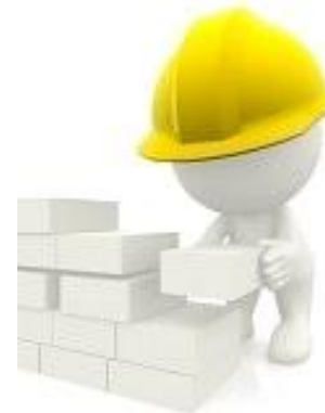
sig. VERDI muratore