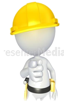
sig. PINCO Caposquadra impresa serramenti THE DOORS