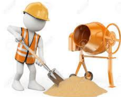
Sig. NERI manovale