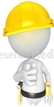
sig. ROSSI capo cantiere