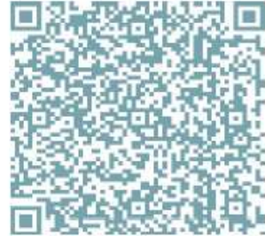
Gruppi di Cammino

Nel territorio dell'ASL TO4 sono attivi da anni i Gruppi di Cammino e i Gruppi di Attività Fisica Adattata : se sei interessato a partecipare, qui sotto trovi tutte le informazioni e gli elenchi di sedi, orari e riferimenti per aderire.