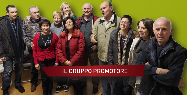
IL GRUPPO PROMOTORE