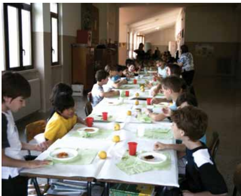
tutti insieme a colazione

Il giorno stabilito si sono divertiti molto sia ad allestire la tavola, lunghissima e colorata, che a consumare insieme la colazione; il tutto è stato rallegrato da cori ispirati al cibo, all'alimentazione, alla buona tavola.