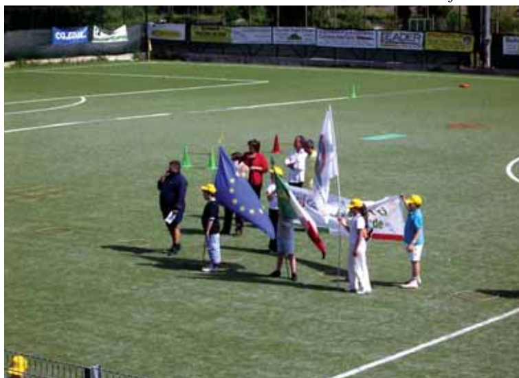
Inizio della manifestazione

La manifestazione ha costituito la sintesi e la verifica delle varie discipline sportive praticate durante il percorso didattico.