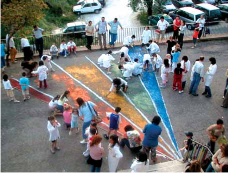
Momenti della serata

AMELIA - Direzione Didattica "J. Orsini"