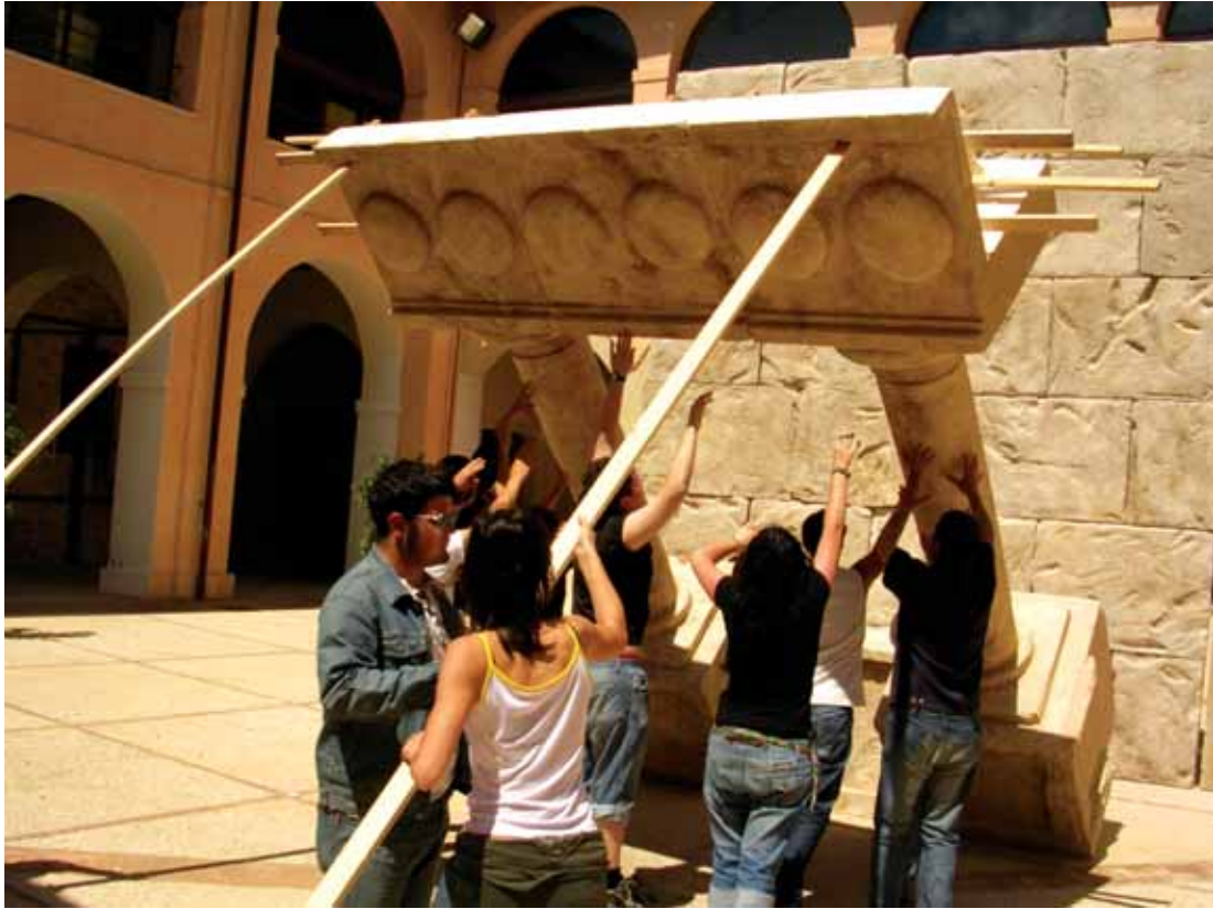
Allestimento della sceneggiatura