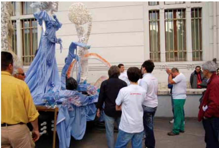
laboratorio di costume e moda

Nell'ambito della manifestazione che l'Ente Cantamaggio promuove nella città di Terni durante tutto il mese di maggio, l'Istituto Professionale per l'Industria e l'Artigianato S. Pertini , ha organizzato un'intensa settimana di attività