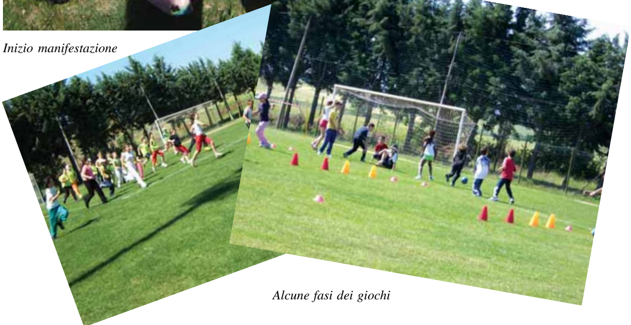
Alcune fasi dei giochi