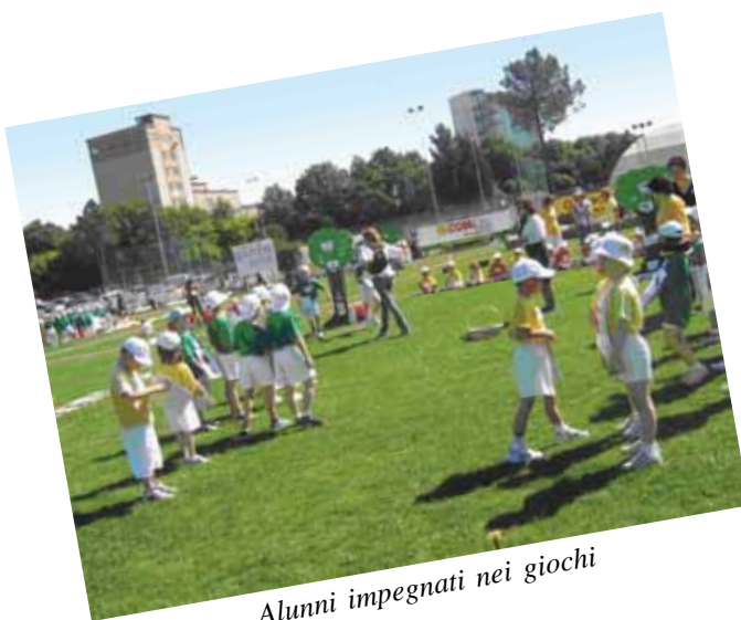
Alunni impegnati nei giochi

Ai giochi erano presenti il Dirigente Scolastico, il DGSA, il Sindaco, l'Assessore alla Cultura e allo Sport, il Presidente dell'A.C. Magione (ente ospitante), numerosissimi genitori e la popolazione di tutto il Comune.