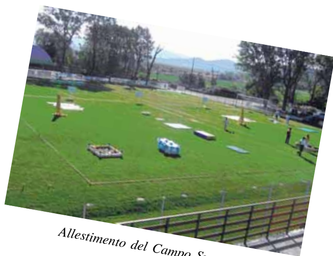
Allestimento del Campo Sportivo